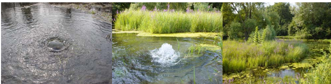
1. Occhio del fontanile, 8 marzo 2003 2. Polla del fontanile Molino, 20 luglio 2003 3. Fontanile Molino, 10 agosto 2003

Dalla foto 1 e 2 è ben visibile l'acqua che sgorga dal sottosuolo, mentre la foto 3 rende l'idea del tipo di ambiente.