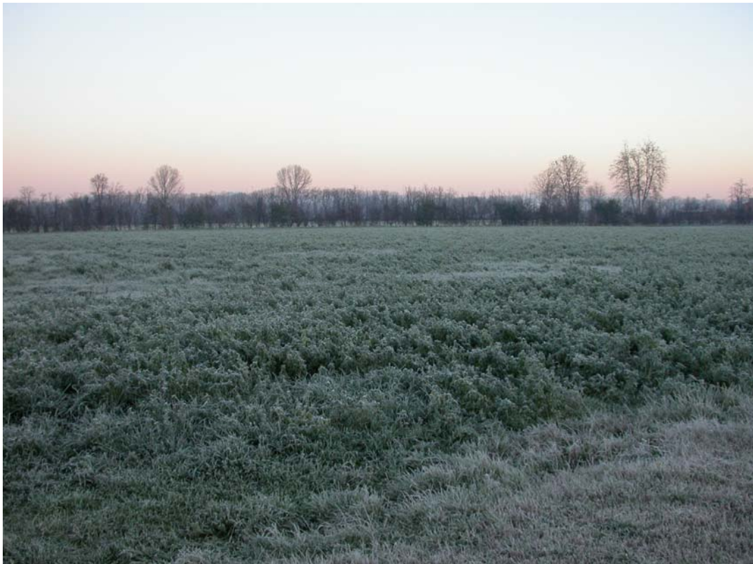
Prato della Riserva Naturale "Le Sorgenti della Muzzetta", 8 dicembre 2003