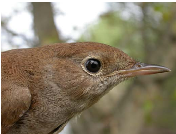
Usignolo, specie caratteristica degli ambienti di fontanile nidificante, presente da aprile a giugno