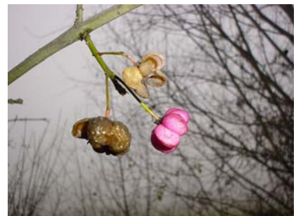
Vegetazione di primavera, 21/04/2003 Capinera, residente da gennaio ad ottobre Euonymus europaeus , 14/12/2002