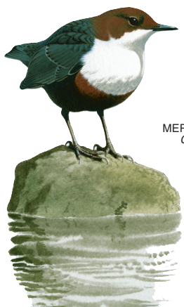
MERLO ACQUAIOLO Cinclus cinclus

In una moderna visione delle tematiche ambientali, emerge la necessità di inserire anche in ambito didattico un'adeguata formazione in campo ecologico.