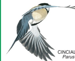
CINCIALLEGRA Parus major