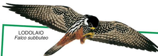
LODOLAIO Falco subbuteo