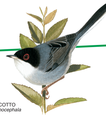
OCCHIOCOTTO Sylvia melanocephala

Potranno inoltre essere concordate lezioni di supporto o di aggiornamento al personale docente. La preparazione degli alunni, prima della giornata da tenersi in campagna, consentirà di approfondire i temi trattati e sviluppare argomenti di ricerca all'interno delle classi.