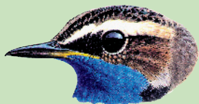
PETTAZZURRO Luscinia svecica

La struttura organizzativa dell'Associazione è suddivisa in settori, la cui gestione è affidata a coordinatori di riferimento, che sviluppano le varie attività con il contributo dei volontari.